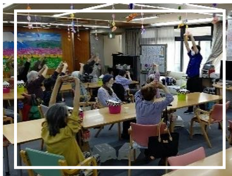
集団プログラムなど