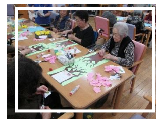
手工芸プログラム