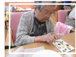
押し花プログラム