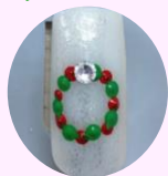
クリスマスに向けて チャレンジしてみませんか?